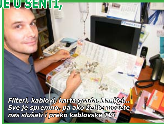
Filteri, kablovi, karta grada, Danijel... Sve je spremno, pa ako želite možete nas slušati i preko kablovske TV!

Unapred se zahvaljujemo na interesovanju!