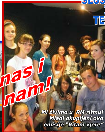
Mi živimo u RM ritmu! Mladi okupljeni oko emisije "Ritam vjere"